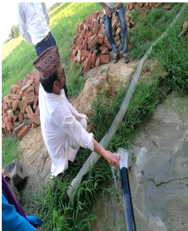
मकै पकेटका कृषकहरुलाई सामग्री हस्तान्तरण जानकी-२ साहुपुरवा बायाँ तथा गाउँपालिका अध्यक्ष बाट मकै पकेटमा सिँचाइ बोरिडको अनुगमन जानकी-२ साहुपुरवा दायाँ ।