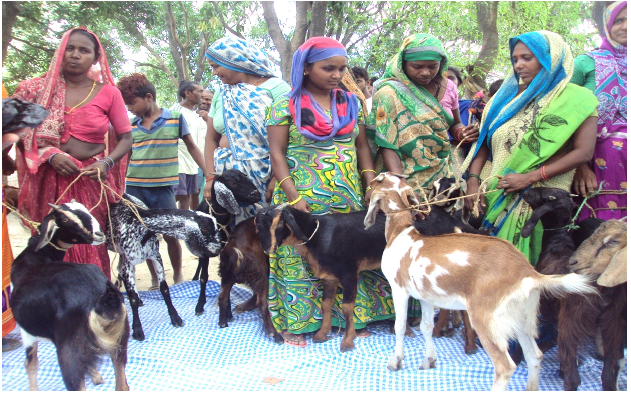
कृषकहरुलाई बाख्रा वितरण गरिदै ।