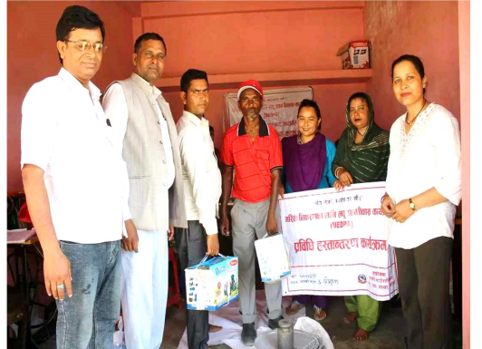
शिप मुलक तालिमका केही भलकहरु