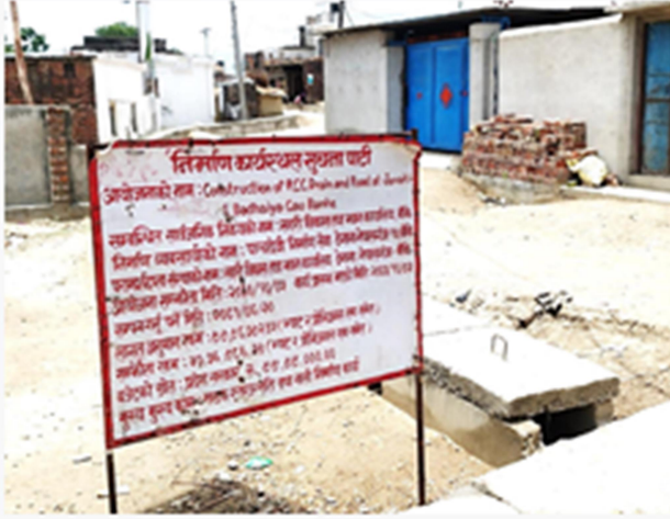
साईगाड १ मा निर्माणाधीन सडक सुस्त गाँतमा निर्माण हुदै

आयोजनाको नाम : सडक निर्माण आयोजना आयोजनाको कुल लागत रकम : ९९९५७९२.४५ लगानी : शहरी विकास तथा भवन कार्यालय बाँके आयोजनाको अवधि : २०८१ मंसिर ३० उपभोक्ता समिति गठन : ठेकेदार कम्पनी मार्फत